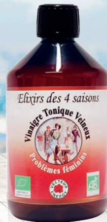
Vinaigre Tonique veineux Été - Problèmes féminins 500 ml

CONDITIONS AVANTAGEUSES PAR PRODUIT ! Offre non cumulable