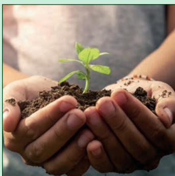
Respect de la plante