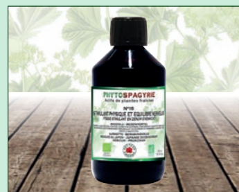
N°15 - Stimulant physique et équilibre nerveux