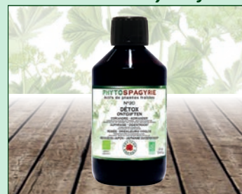
N°20 - Detox