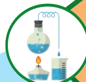
2 - DISTILLATION (Evaporation de l'alcool remplacé par la glycérine végétale)