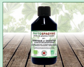
N°1 - Hépatique et digestion