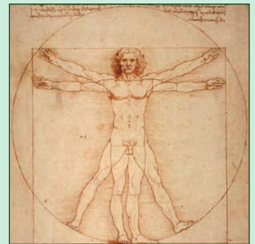
Harmonisation de l'être humain