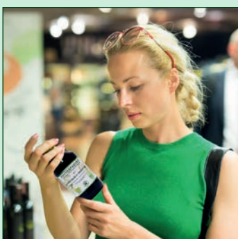
Respect du consommateur