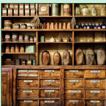
Respect de la tradition