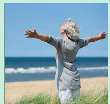
La santé retrouvée