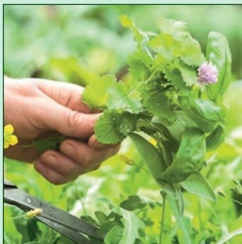
Respect de la cueillette

Les techniques de préparation des remèdes spagyriques exigent une connaissance approfondie de la Nature et du Cosmos, les alchimistes s'appelaient Philosophes de la Nature