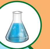
Teinture mère sans alcool (Concentré 15% de matière première) Principes actifs (analyse - contrôle)