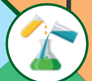
4 - RÉUNIFICATION (Des composants et sels minéraux de la plante)

La Panacée, la Quintessence, la Traçabilité, L'Innocuité, l'Efficacité sont réunis, pour votre santé.