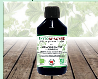
N°7 - Amincissement