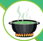
1 - DIGESTION Macération 37° de 1 à 7 jours Vin Bio IGP Cévennes (Alcool + glycérols + polyphénols)