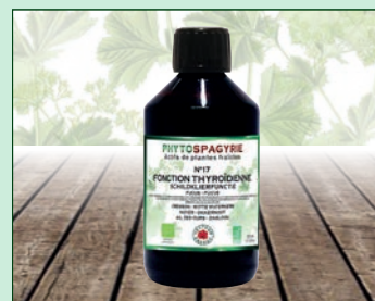
N°17 - Fonction thyroïdienne

Nos 6 meilleures ventes : synergies 300 ml