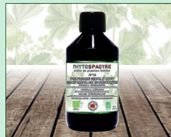
N°19 - Stress passager mental et oxydatif