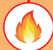
3 - CALCINATION (Du gâteau de pressage)