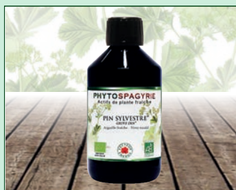
Aiguilles de pin

En fonction de l'évolution de la législation, les allégations de nos compléments alimentaires sont susceptibles de changer