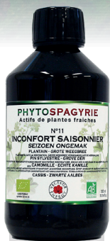
PHYTOSPAGYRIE N°11 INCONFORT SAISONNIER

OFFRE TRIMESTRIELLE RÉSERVÉE AUX MAGASINS DÉTAILLANTS