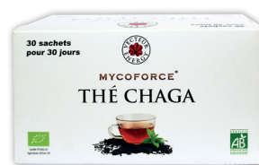
MYCOFORCE THE CHAGA