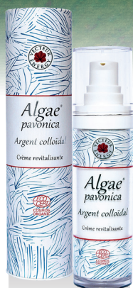
ALGAE PAVONICA CRÈME REVITALISANTE

OFFRE PONCTUELLE RÉSERVÉE AUX MAGASINS DÉTAILLANTS