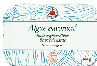
ALGAE PAVONICA SAVON SURGRAS

Conditions avantageuses (Offre non cumulable)