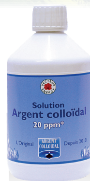
ARGENT COLLOÏDAL TRADITION 1 LITRE ET 500 ML